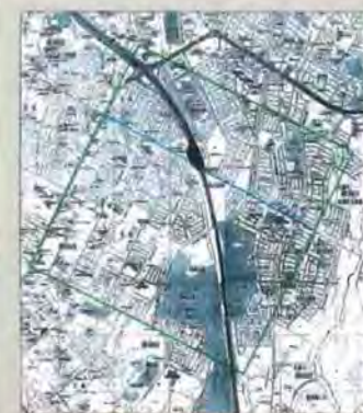
図:緑の枠線内が山鼻屯田給付地。現在の地図に落とすと、ご覧のような範囲になる。左の境が御料線道路。右下に平岡公園。真ん中の太い黒線は道央自動車道(図:了寛紀明氏)

この山鼻屯田給付地は、山鼻兵村から遠隔地にあったため、実際に屯田兵が開墾することはありませんでした。近隣の農家に小作をさせて、小作料を収入にしていたようです。この給付地は明治39年以降、小作人らに売却されていきました。