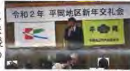
岩本参議院議員挨拶

○大抽選会裏話～会長、所長が半年かけてへそくった各種頒布品(ラップ・ビスコ・軍手・災害時用水袋)等、あるだけ役員2名と袋詰。更に二人の役員が賞品代予算で選んだオリーブオイル・昆布等一見高そうな品物を混ぜて56人分を用意。抽選で米5Kが6人に当たり皆大喜びで大興奮。更に会長が1時間待たされ「きのとや」で試食用に買った有精卵を、全員にお土産として進呈。(これは大ヒットか!有り難う!の声が多数でした)