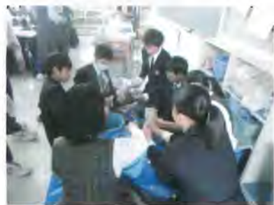
④スベラズボトル活動