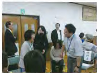
③平岡地区 SOS ネットワーク検索研修会

10月5日(土)に平岡地区会館で行われました。清田消防署の協力のもとで行われ、昨年9月の胆振東部地震の教訓を忘れることなく、保健の授業で習った救命講習や三角巾を用いた救急法について改めて学ぶことができました。