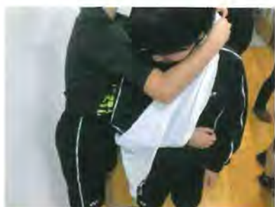
②平岡地区防災訓練