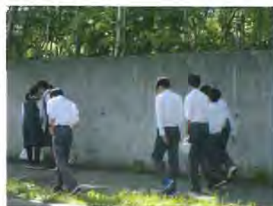
①ボランティア清掃

例年、春と秋の2回にわたり、校区内のボランティア清掃を行っています。今年も生徒会の呼びかけに、多くの生徒が参加して真剣に清掃活動を行いました。